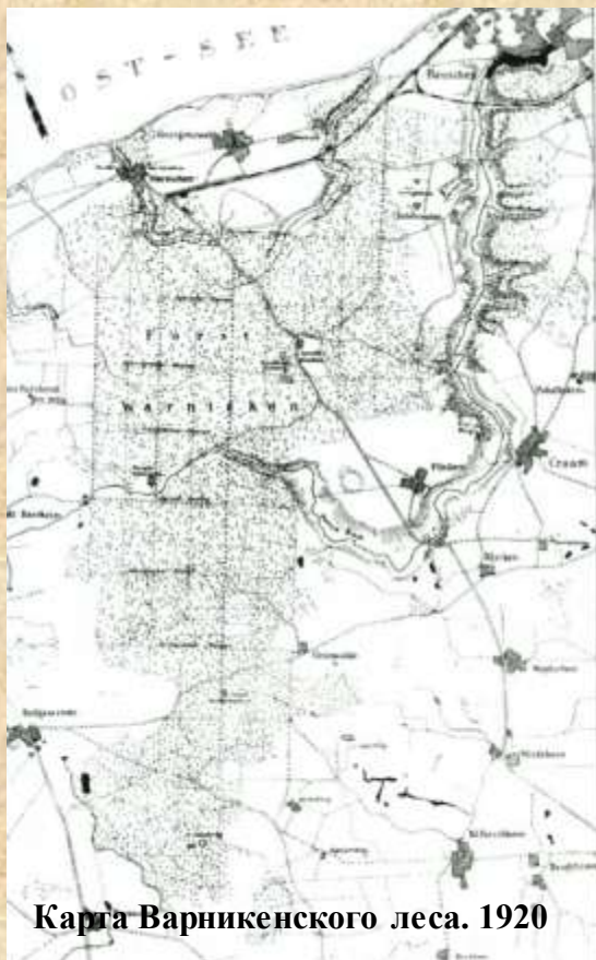
Карта Варникенского леса. 1920

Многие годы прусское правительство заботилось о сохранении Варникенского леса. Но впоследствии в нем стали проводить вырубку деревьев и площадь леса значительно сократилась. Если в 1790 г. площадь леса охватывала 18396 моргенов, то в 1812-1813 гг. из-за удовлетворения прав прилегающих населенных пунктов на лес и пастбища и пашни, убыль леса составила около 7 тыс. моргенов. На этом наступление на лесные угодья не закончилось. В 1824 г. площадь леса сократилась до 9728 моргенов. Предполагалось лес вырубить почти полностью. К началу 20-х годов XX в. занимаемая лесом площадь составила 2190 гектаров, из которых большая часть - 1940 гектаров являлась местом вырубki леса.