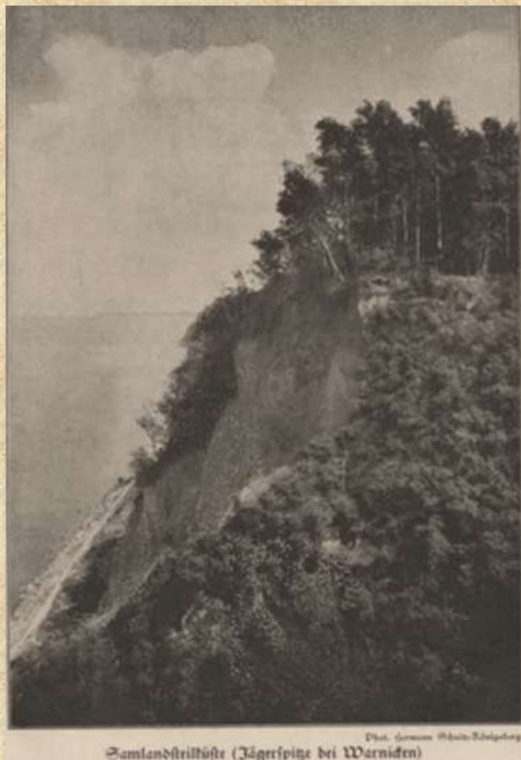
Варникен, Охотничий мыс

Восточную часть Волчьего оврага обрамлял Охотничий мыс (Jagerspitze), названный также Бельведером (в пер. с итал. - прекрасный вид). От мыса вниз вела лестница-почти 200 ступенек, -неоднократно разрушаемая обрушением берега.