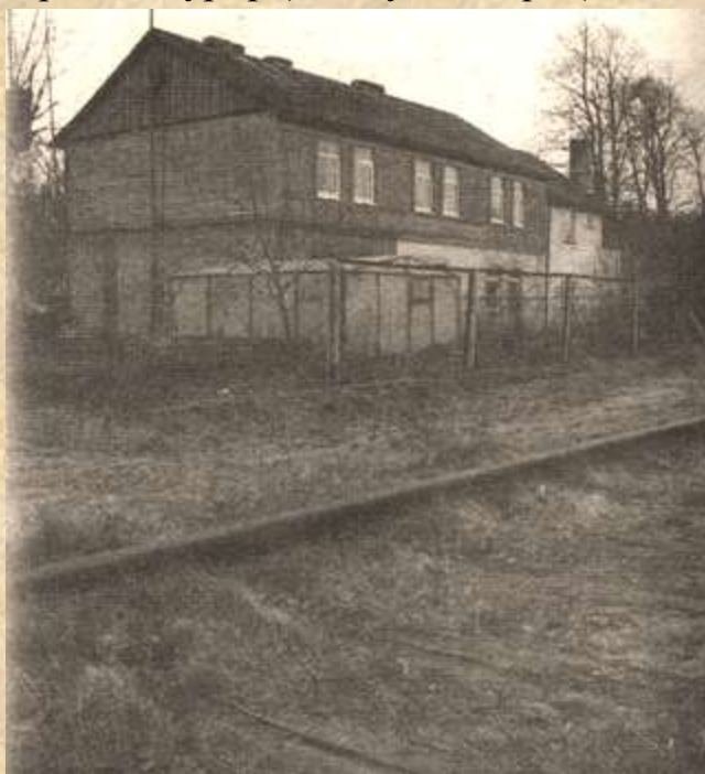
Здание бывшего Варникенского вокзала, вид 2010 г.

Здание вокзала Варникен построено в стиле загородных домов, аналогичное нойкуренскому (Пионерский Курорт) и Раушен-Орт (Светлогорск-1).