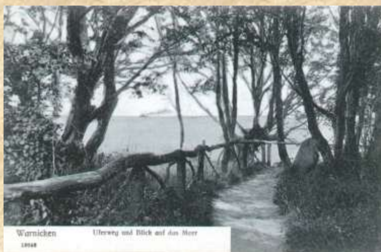
Смотровая площадка в Варникенском парке с видом на море