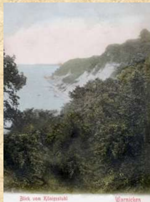
Место на берегу Варникена «Королевский стул»

В книге «Исторические маршруты по землям Пруссков» вот как описываются окрестности Варникена: «Уже в 19 веке поселок слыл центром крупного государственного природного заповедника «Варниккер Форст». Этот грандиозный лесной массив, начинается на юго-западе у городища Гросс Хаузен ( Замковая гора — Гросс Хаузен (Домашняя)). Расположена в 2—3 километрах от поселка Гермау (ныне Русское). Ее можно увидеть слева от шоссе, если ехать по дороге на Красноторовку. Высота горы 88 метров. До наших дней она сохранила очертания древней прусской крепости в виде валов, засек, серпантинного подъема и центральной оборонительной площадки) и простирается на 15 км. до морского побережья.