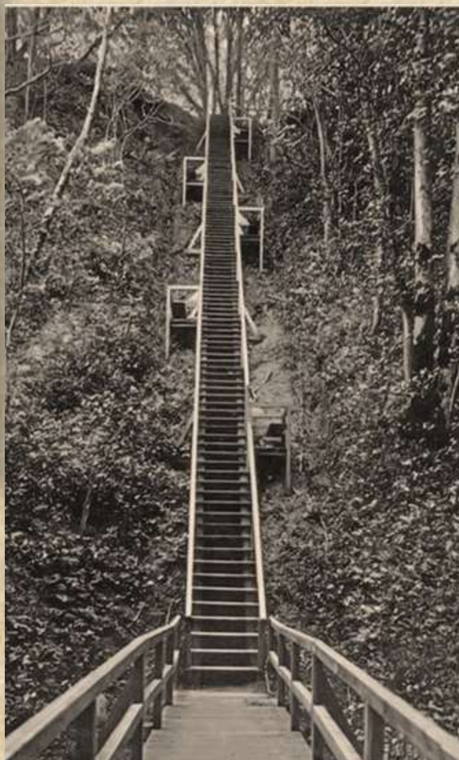
Лестничный спуск к морю