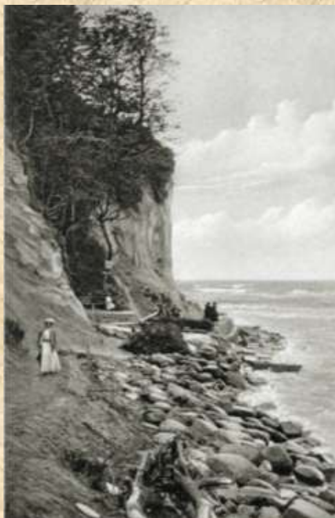
Варникенский пляж. 1899-1909 гг.

Свое послевоенное название поселок получил неслучайно, т.к. с севера и юга он окружен красивым лесом. Как привлекательное место для отдыха, Варникен упоминался еще в 1912 г. в издании «Путеводитель по Кенигсбергу и его окрестностям для русских путешественников». В брошюре даны советы каждому российскому путешественнику «побывать в поселке, т.к. впечатление останется неизгладимым, ибо Варникен не без основания считается самым красивым уголком всего Земланда» .