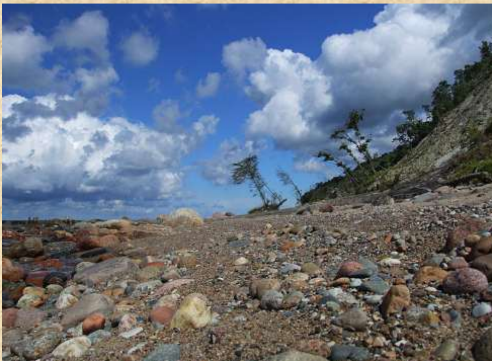
Морское побережье, пос.Лесное

Поселок Лесное (нем. название Варникен/Warnicken) - небольшое поселение, входящее в МО «Городское поселение поселок Приморье» Светлогорского района. Расположен в 6-7 км. от г. Светлогорска. На его территории находятся 33 жилых дома. Отсутствие каких-либо промышленных производств позволило сохранить до настоящего времени первозданную природную красоту и привлекательность.