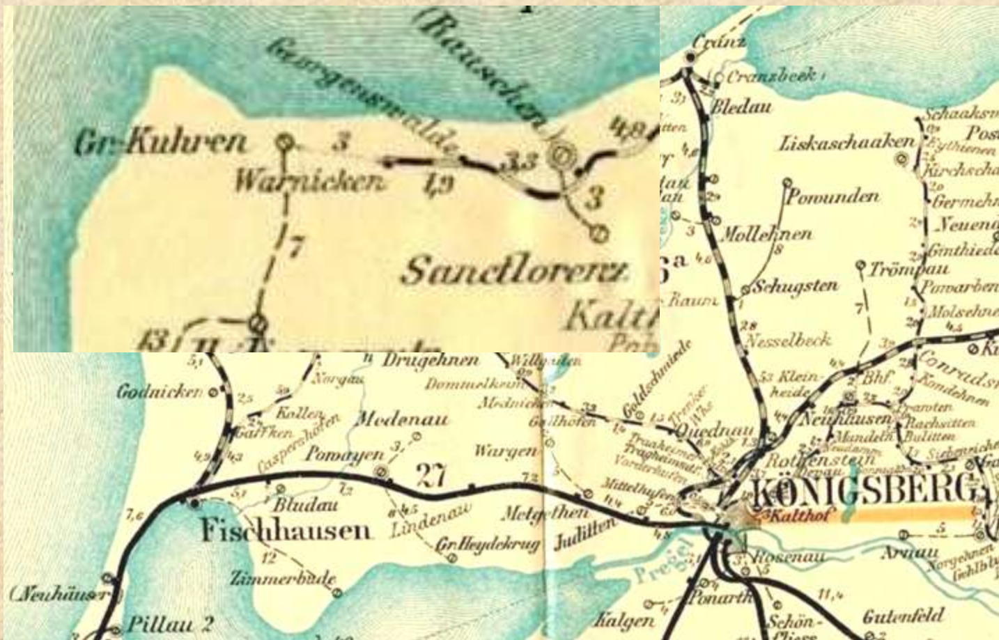
Карта узкоколейной Замландской железной дороги. 1904 г.

Здание вокзала Варникен построено в стиле загородных домов, аналогичное нойкуренскому (Пионерский Курорт) и Раушен-Орт (Светлогорск-1).