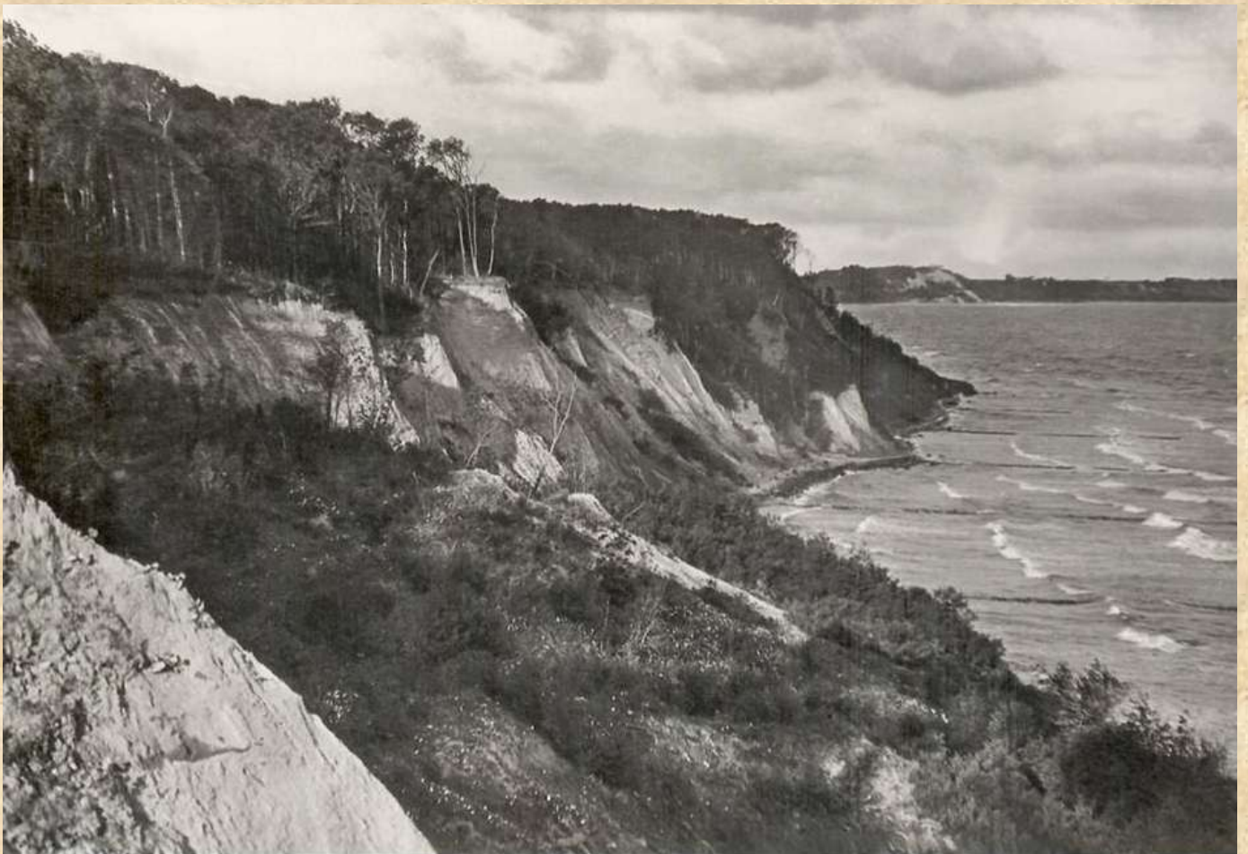
Warnicken, Steilküste. 1935-1942

Достаточно сильное морское течение очень быстро размывает и уносит сползшие земляные массы. По многолетним наблюдениям отступление берега в 20-30-х годах XX века составляло ежегодно около 0,5 м. Это позволило оценить общие потери земландского побережья от Кранца (г.Зеленоградск) до Пальменикена (Янтарный) - общей протяженностью 43 км.- примерно в 2,2 гектара.