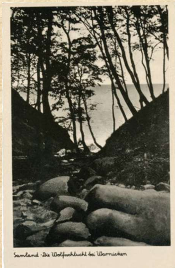
Samland - Die Wolfschlucht bei Warnicken